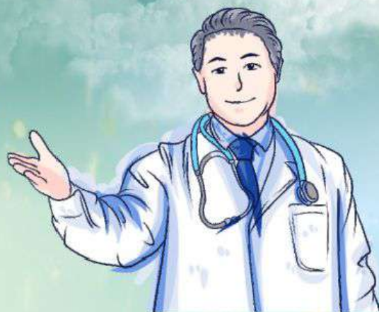
美沙冬服藥流程圖（由個管師示範）